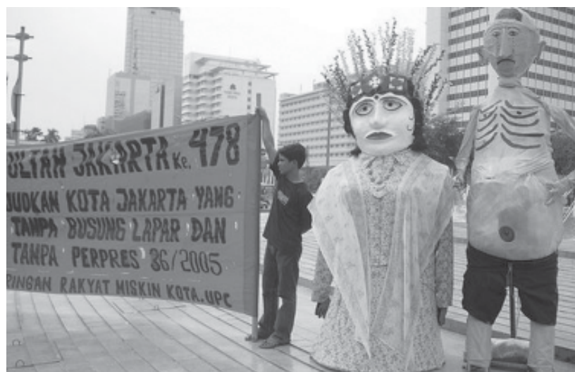
DEMONSTRASI--Aksi ulang tahun Jakarta 478 tanpa busung lapar, tanpa perpres 36/2005 (tentang Pengadaan Tanah bagi Pelaksanaan Pembangunan untuk Kepentingan Umum.)

(Ditulis kembali dari profile UPC oleh daan).